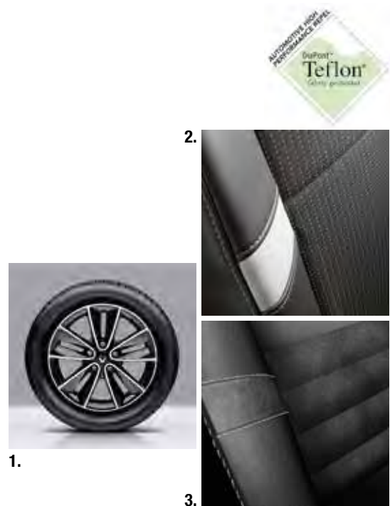
1. Leichtmetallräder „Black Sari“ , 17 Zoll, serienmäßig. 2. Stoff-Textillieder-Polsterung in Anthrazit, serienmäßig. 3. Leder-Alcantara-Polsterung* in Anthrazit, optional. * Sitzmittelbahn und Sitzzangen in Leder mit Alcantara-Applikationen.